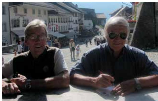
▼ Sortie des aînés à Gruyère 2011