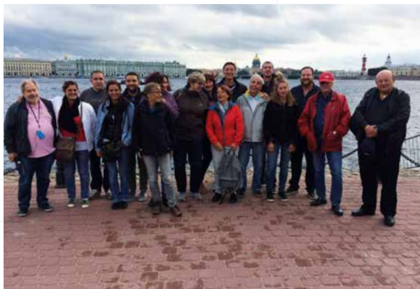
Les autorités communales 2015 – 2020

A la demande de la commune, l'Etat a consenti à financer une nouvelle étude qui doit permettre d'identifier les opportunités restantes en matière de développement. Avully possède un atout majeur en étant propriétaire de grandes surfaces constructibles, à Gennecy, ou possiblement constructibles aux alentours du groupe scolaire et à proximité du village, dans un terme plus ou moins proche, à l'instar de ce que prévoyait le plan directeur communal de 2008. Assurément l'aménagement, duquel découle nombre de politiques publiques, est l'un des défis qui attendent les autorités municipales de la prochaine législature.