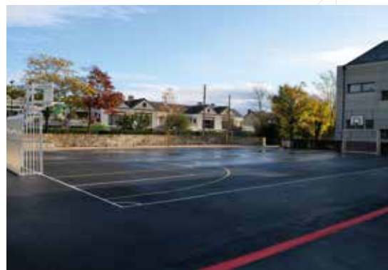
Le préau Braillard "new look"

de ressurfaçage de portions de routes, d'aménagements extérieurs, d'entretiens du parc arboricole, des espaces verts et des chemins vicinaux, des conduites, de machineries, de chaudières ou encore d'éléments constructifs ont ainsi largement occupé le service technique. Côté réalisations plus marquantes, citons la réfection de la partie amont du chemin du Martinet, du préau de l'ancienne école Braillard, en y adjoignant des éléments de jeu, celle du point de vue de Saint-Gervais; le remplacement des panneaux électrisés d'affichage public ainsi que d'une clôture de 200m au chemin des écoliers; l'installation de tableaux blancs interactifs dans les classes de l'école, de luminaires éclairant le nouvel arrêt de bus des Bachères