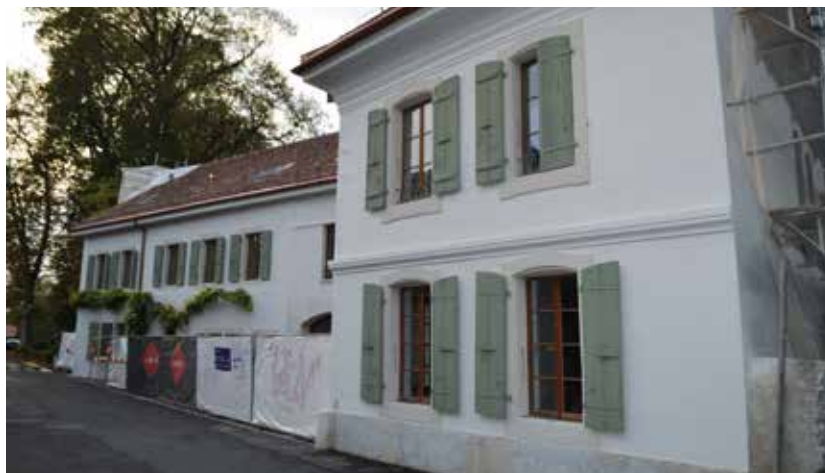
L'îlot du presbytère

La réfection de l'îlot du presbytère, avec la création de 8 appartements et d'un parking, se dresse, sans conteste, comme l'étendard de cette législature. Le dernier investissement comparable à Avully remonte à 1997, date de l'achèvement de la construction de l'immeuble du 29-31 route d'Epeisses.