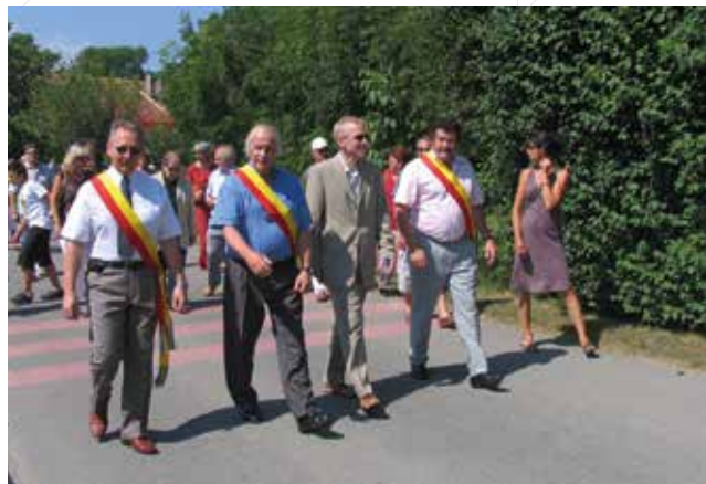
▼ Cortège des Promotions 2006

Salut, Monsieur le maire, et merci pour tout !