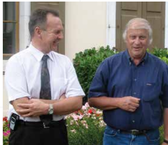
▼ Législature 1999 - 2003